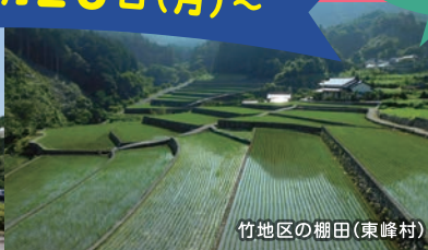
竹地区の棚田(東峰村)