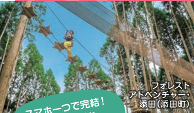
フォレスト アドベンチャー 添田(添田町)