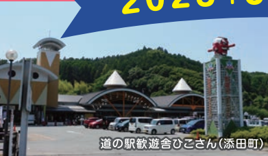
道の駅歓遊舎ひこさん(添田町)